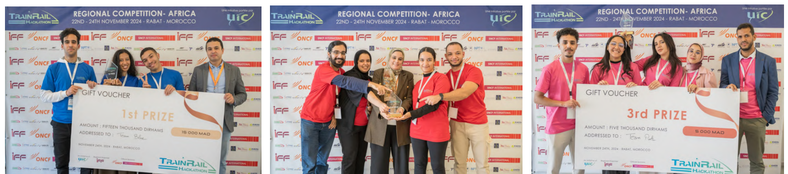
1er prix : Team Blue 🙌

La 1ère équipe représentera l'Afrique lors de la finale à Chengdu (Chine) au Congrès mondial de l'UIC sur la formation ferroviaire (WCRT 2025) le 8 avril 2025. Félicitations à tous les participants et à leurs coachs!