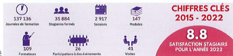
↑ [1] Chiffres clés de l'IFF 2015-2022.

La raison d'être de l'IFF est d'incarner, par le développement des compétences et du partage d'expériences, un outil de la politique de responsabilité sociétale des entreprises (RSE) de ces groupes ONCF et SNCF. Dans un cadre de valeurs partagées, l'IFF assure la définition et la mise en place de l'expertise au plus proche des projets dans les pays en animant les montées en compétences des