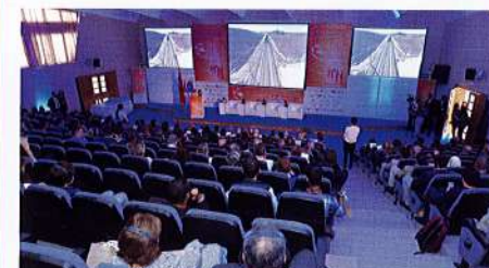
↑ [6] Congrès de l'UIC sur la formation ferroviaire.