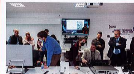
↑ [5] Journées techniques du transport urbain guidé.