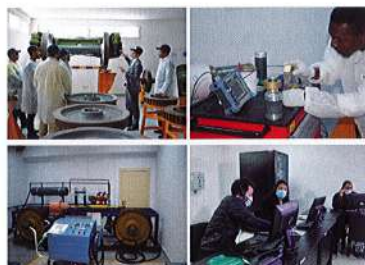
7 salles de travaux pratiques avec des maquettes pédagogiques