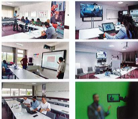
18 salles de formations dont 8 équipées de tableaux numériques interactifs et 5 équipées pour réaliser des classes virtuelles.