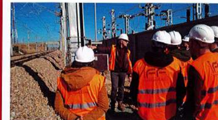
↑ [3] Sortie terrain - Formation en circulation et signalisation.

L'IFF, peut intervenir en amont ou en aval d'une formation en proposant du conseil en formation, en accompagnant des entreprises dans la montée en compétences de leurs propres formateurs tout comme en apportant son expertise en matière de techniques pédagogiques et ingénierie de formation.