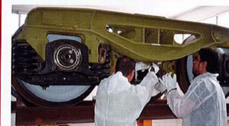
↑ [4] Formation matériel roulant.