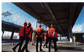
Management de projet