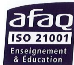
↑ [9] Logo de la norme ISO 21001.

La certification ISO 21001 [9] (norme relative aux systèmes de management des organismes d'éducation et de formation) délivrée en 2021 par l'AFNOR [10] témoigne du professionnalisme des équipes.