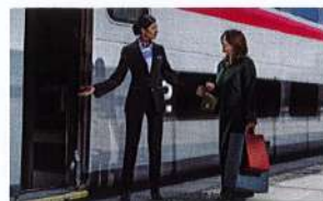
Commercial, service aux voyageurs