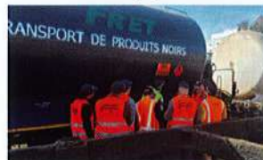
Fret - Logistique