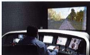
Conduite des trains