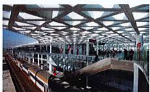
Bâtiments, gares et patrimoine