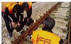
Infrastructure, maintenance et travaux