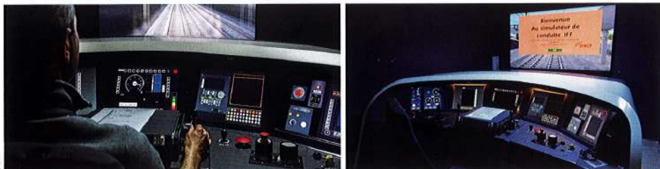
↑ [8] Simulateur de conduite multifonctionnel.