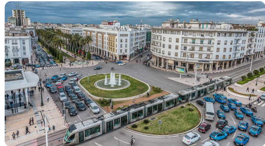
Centre ville de Rabat